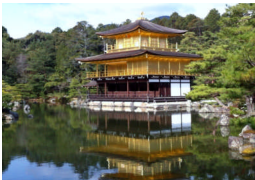
「金閣寺」撮影 柏木壽夫会員

承認 昭和28年3月2日 事務所 〒646-0031 田辺市湊1073-63 TEL 0739-24-2002 FAX 0739-26-0264 mail tanabe-rc@helen.ocn.ne.jp