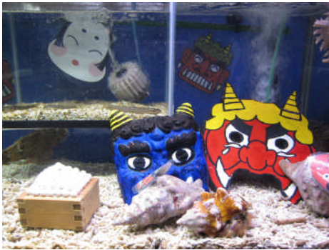
「すさみ海立エビとカニの水族館」

承認 昭和28年3月2日 事務所 〒646-0031 田辺市湊1073-63 TEL 0739-24-2002 FAX 0739-26-0264 mail tanabe-rc@helen.ocn.ne.jp