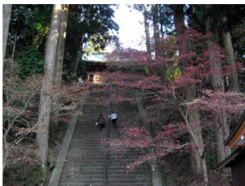
「延暦寺三門」撮影 寺前則彦会員

承認 昭和28年3月2日 事務所 〒646-0031 田辺市湊1073-63 TEL 0739-24-2002 FAX 0739-26-0264 mail tanabe-rc@helen.ocn.ne.jp