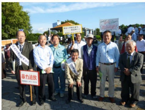
「暴力追放街頭啓発パレード-10月18日-」

承認 昭和28年3月2日 事務所 〒646-0031 田辺市湊1073-63 TEL 0739-24-2002 FAX 0739-26-0264 mail tanabe-rc@helen.ocn.ne.jp